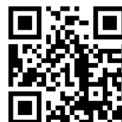
日本レクリエーションルカヌー協会