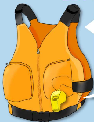
ライフジャケット

体型に合ったサイズを選ぶ。チャック、バックル、ベルトをしっかり締めよう。周囲の船や陸から見つけやすい目立つ色(黄、オレンジ等)を着用しよう。