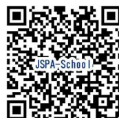
日本セーフティーパドリング協会